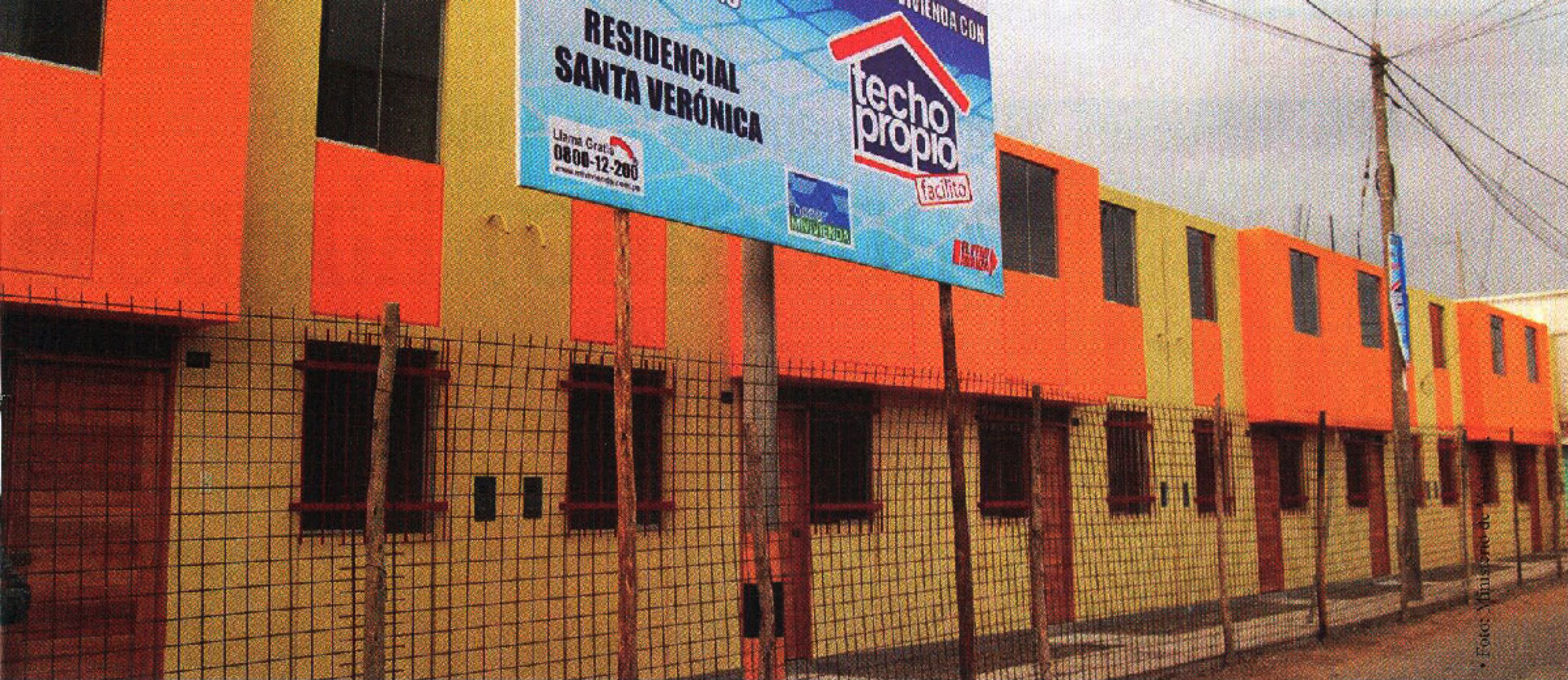
• Gran brecha. En México, la construcción de viviendas sociales llega a un millón anualmente. En Chile son 200 mil viviendas, y en el Perú, 35 mil viviendas populares.