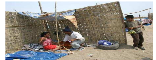
Con un viceministro de Vivienda devaluado, poco se puede hacer para promover la construcción de casa en las zonas urbano-populares y, de ese modo evitar invasiones desordenadas como la ocurrida en el distrito de Villa El Salvador

La propuesta del Colegio de Arquitectos contempla también la implementación del Sistema de