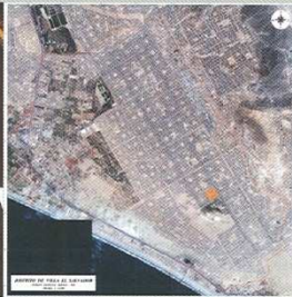
Villa el Salvador