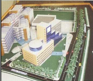
Nuevo Campus USIL

Por ello, postula una estructura curricular que integra la VISIÓN, INVERSIÓN, TECNOLOGÍA Y GESTIÓN con el MERCADO, LAS EDIFICACIONES, LA CIUDAD Y EL TERRITORIO. Este nuevo enfoque permitirá contribuir con el logro de una SOCIEDAD de EMPRENDEDORES, CIUDADES HUMANIZADAS Y TERRITORIOS PRODUCTIVOS.