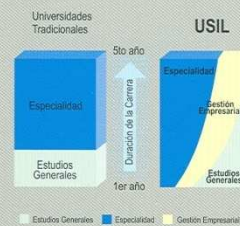
■ Estudios Generales ■ Especialidad ■ Gestión Empresarial

En la Universidad San Ignacio de Loyola los alumnos son nuestra razón de ser, y como tal, reciben de nosotros un trato y seguimiento personalizado, tanto de la plana docente como administrativa, a fin de asistirlos constantemente en su proceso de aprendizaje y formación integral a lo largo de toda su carrera.